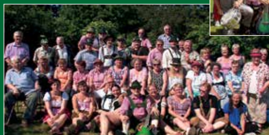
Fan Klub i Danmark:

http://www.alpenspektakel-fanclub-danmark.dk/