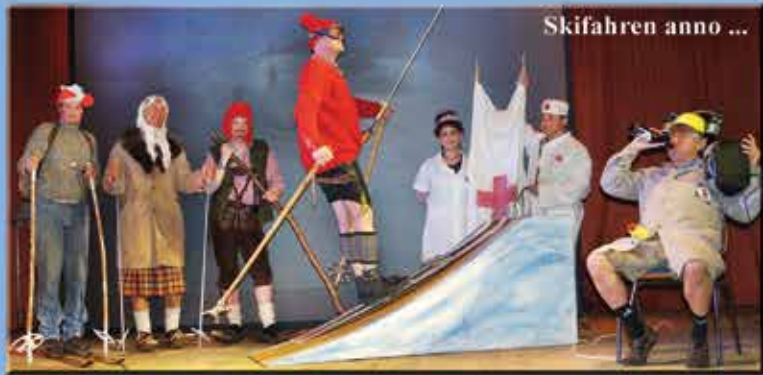
Skifahren anno ...

ALPENSPEKTAKEL hat noch so manches in RESERVE ALPENSPEKTAKEL has lots more in store ALPENSPEKTAKEL har stadig en masse numre i reserve ALPENSPEKTAKEL hebben nog veel reserves achter de hand