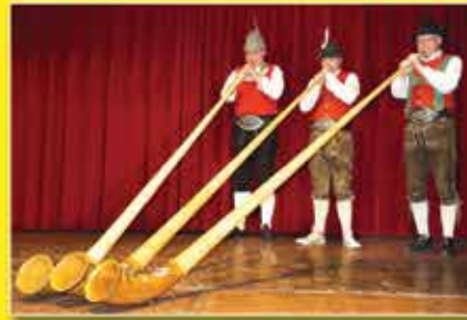
Eröffnung mit 3 Alpenhörner