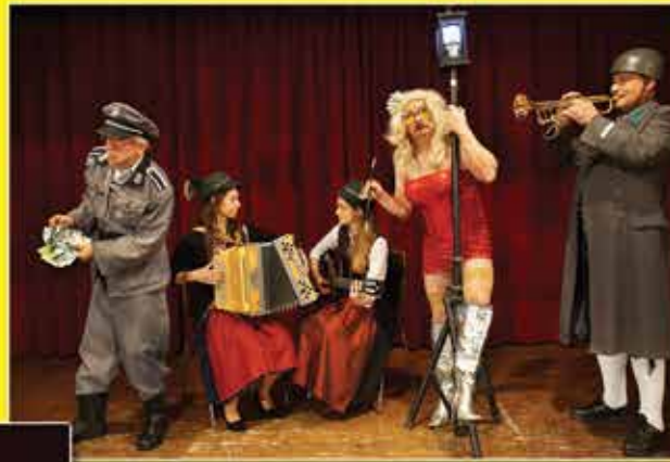
Lilli und die Laterne ! Lilli and the lantern Lilli og gadelampen Lili en de straatlantaarn