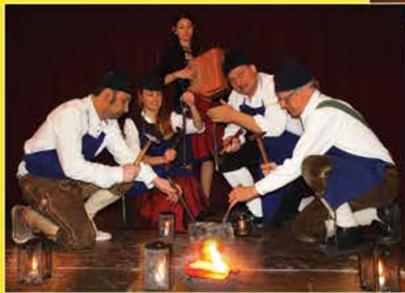
Aus dem 17. Jahrhundert der Bergknappentanz The Miners' Dance from the 17th century Traditionel bjergdans fra det 17. århundrede De mijnwerkersdans uit de 17e eeuw