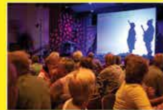
TV equipment voor de live en multimedia show