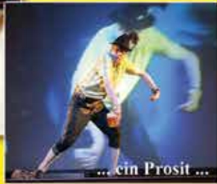
... ein Prosit ...