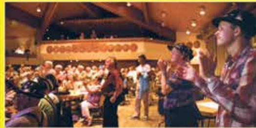
Gute Unterhaltung !