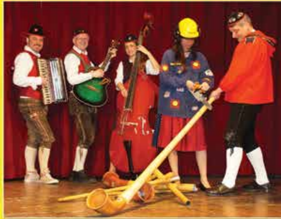
Der Alphornsagler - The alpine horn-cutter Alpehorn snedker - Alpenhoorn zagen