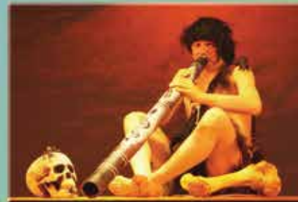
Hutuh der Urmensch Hutuh the Primitive