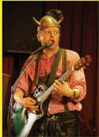
Musik aus Deutschland, England, Dänemark, Niederlande...