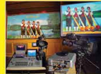
bis 14m 2 Videowand