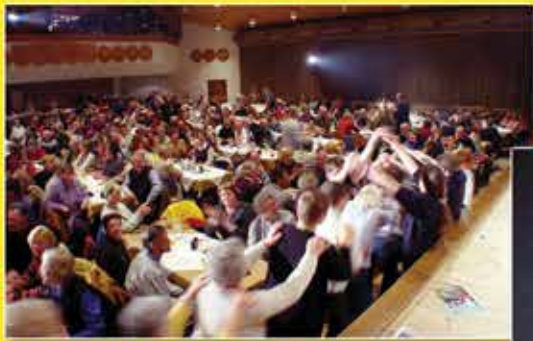
...gute Laune und Stimmung...