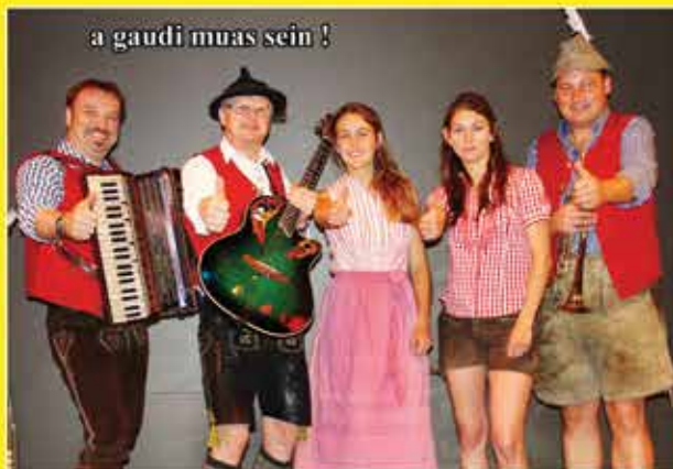
a gaudi muas sein !