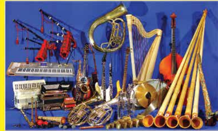
Über 25 Instrumente finden beim Alpenspektakel ihre Anwendung. Die Ton- und Lichtanlage steht bei den Aunern im Hintergrund, dennoch ist auch diese immer auf den neuesten Stand der Technik.