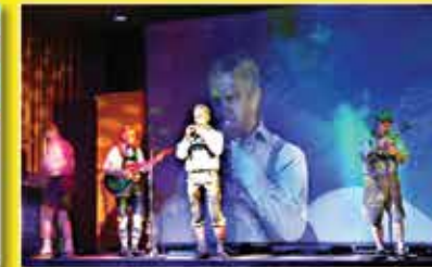
TV-Equipment für die Live und Multi-Media Show