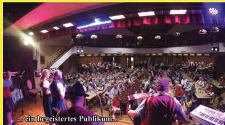
... ein begeistertes Publikum...